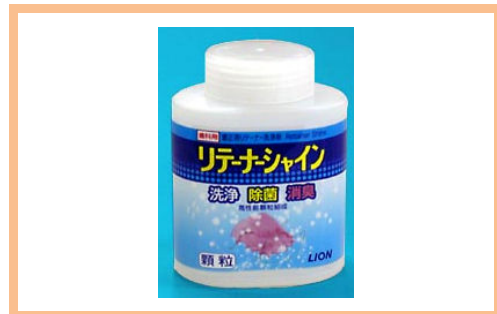
リテーナーシャイン 840 円