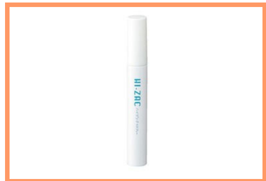
ハイザックNスプレー 900 円