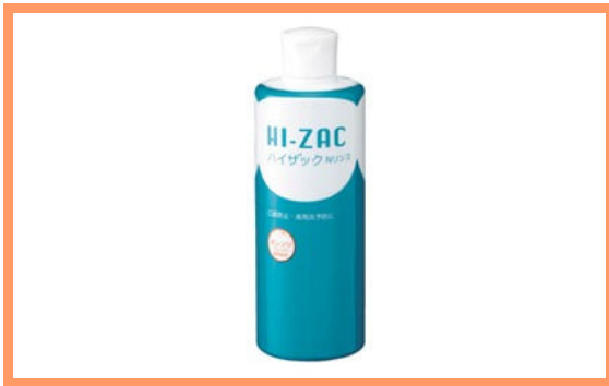
ハイザックNリンス 1,600 円