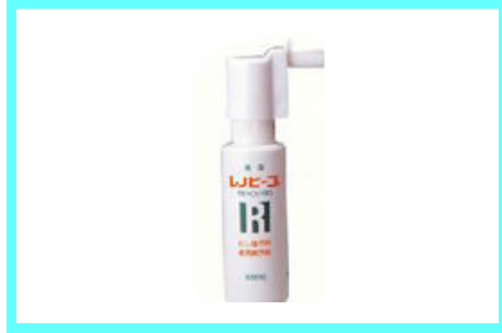
レノビーゴ フッ素配合スプレー 1,200 円