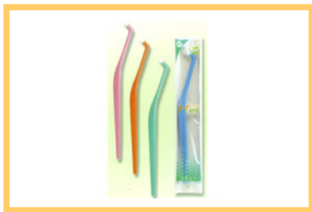
ピーキュア 290 円