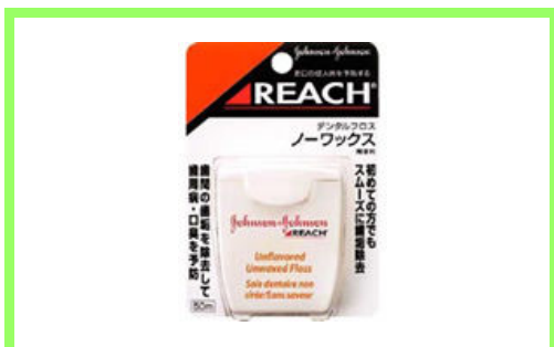
REACH デンタルフロス 525 円