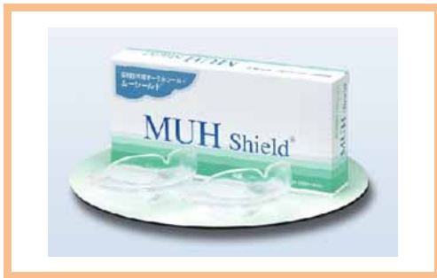
ムーシールド 15,000 円