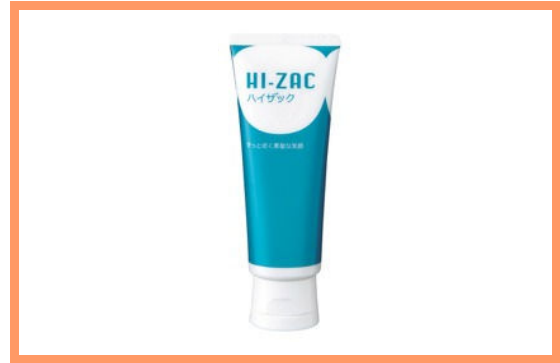
ハイザックペースト 1,500 円