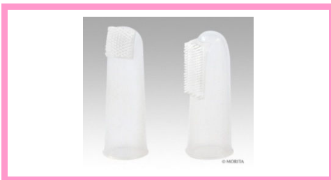
赤ちゃん歯ブラシLOVE 1,050円