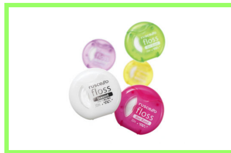
ルシェロフロス 310 円