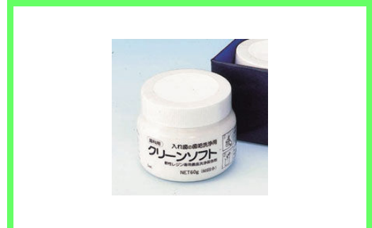
クリーンソフト 880 円