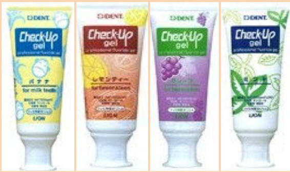
バナナ レモンティー グレープ ミント