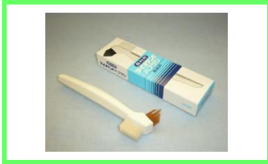
ライオデントハブラシ 525 円