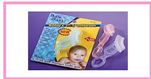
ベビートゥースブラシ 800円