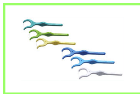
DENT.EX ウルトラフロス 210 円