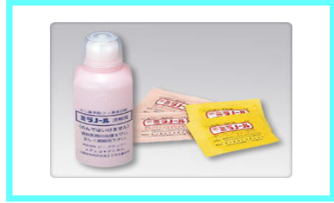
ミラノール フッ素洗口剤 黄色 500 円 ピンク 700 円