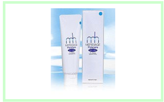
メルサージュ ヒスケア 950 円