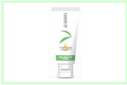
ルシェロペーストマステント 1500 円