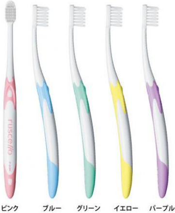
ピンク ブルー グリーン イエロー パープル